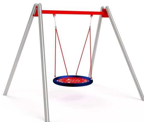
Rys. 3. Przykładowy wygląd huśtawki bocianie gniazdo.

Siedzisko – BG- certyfikowane „bocianie gniazdo”.