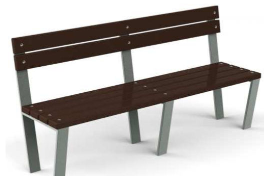
Rys. 14. Przykładowy wygląd ławki

Ławka z oparciem posadowiona w gruncie za pomocą betonowej stopy fundamentowej.