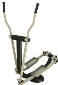
Rys. 5. Przykładowy wygląd przyrzędu orbitrek.