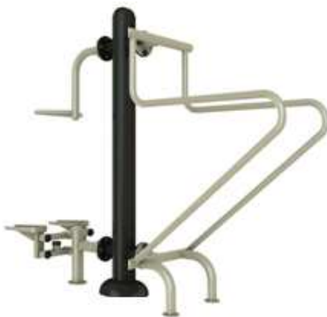
Rys. 10. Przykładowy wygląd przyrządu stepper/poręczce.

Wszystkie elementy stalowe ocynkowane ogniowo i malowane podwójnie proszkowo farbami poliestrowymi.