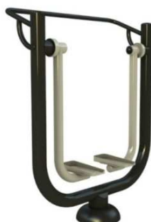
Rys. 6. Przykładowy wygląd przyrządu biegacz.

Wszystkie elementy stalowe ocynkowane ogniowo i malowane podwójnie proszkowo farbami poliestrowymi.