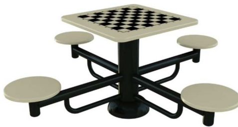
Rys. 13. Przykładowy wygląd stołu do gry w szachy.