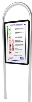
Rys. 11. Przykładowy wygląd regulaminu.