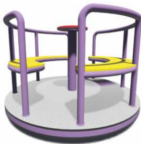
Rys. 2. Przykładowy wygląd karuzeli

Montaż – elementy mocowane bezpośrednio w betonowych fundamentach.