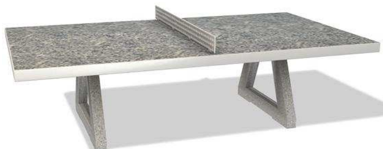
Rys. 12. Przykładowy wygląd stołu do gry w tenisa stołowego.

Wymiary 274cm długość x 152cm szerokość.