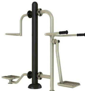
Rys. 9. Przykładowy wygląd przyrządu surfer/twister.