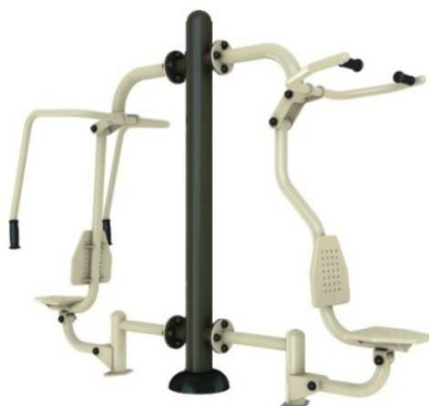
Rys. 8. Przykładowy wygląd przyrządu wyciąg/krzesło.