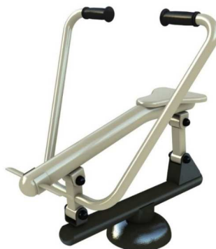
Rys. 7. Przykładowy wygląd przyrządu wioślarz.

Wszystkie elementy stalowe ocynkowane ogniowo i malowane podwójnie proszkowo farbami poliestrowymi.