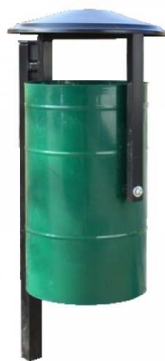
Rys. 15. Przykładowy wygląd kosza na śmieci.